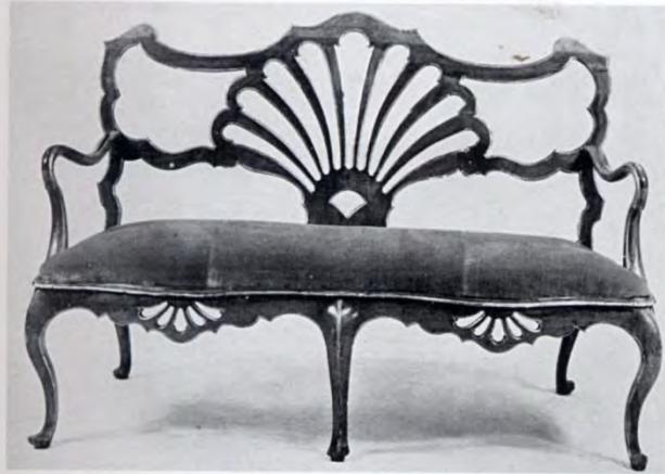
Divano, manifattura veneziana, terzo quarto del XVIII secolo. Collezione privata.